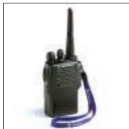
JMZN4020 Pasek do noszenia w dłoni