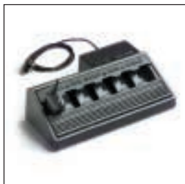
MDHTN3004/MDHTN3005 Ładowarka wielostanowiskowa Z wtyczką europejską / z wtyczką brytyjską