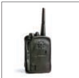
PMLN4521/PMLN4421 Lekki futerał skórzany z obrotowym zaczepem do paska