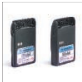
MDJMNN4023/MDJMNN4024 Akumulator Lilon o pojemności 1000 mAh / Akumulator Lilon o pojemności 1320 mAh